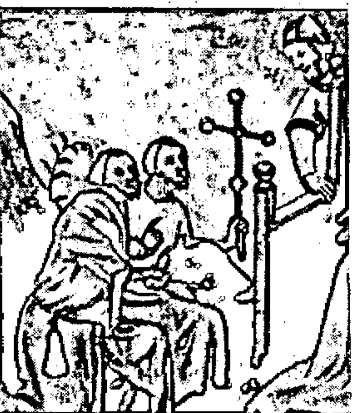
চীন সন্ন্যাসী কুবলাই খানের দৃশ্য

ছেলেমে... একটি বি... ছেড়ে দে... থাকে বে... বিদ্যাতে... থেকে... পাঠ্যক্র... শ্রেণীসমূ... পারে) প... যেমন প... পুকুরের... অত্যন্ত হ... শিশুরা প... উন্নত ও... দেওয়া... স্কুলের (... পড়ে)।... তাদের... হলে নে... 'দোকান... কিছু নে... বেচা-... বিয়োগ... আবার... ডুবলো... অনেক... শেখাতে... শ্রেণী... পড়া... থেকে... তোলা... দেশ... জীবন... বোঝা... ফলে... ভাষা... ফলে... শেখা... লেখা... ইষ্টিকুটমের