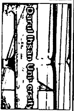
রাজশাহী সিটি ক্যাশিয়ার