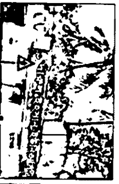
রাজশাহী সিটি ক্যাশিয়ার