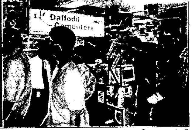
১৯৯৯ ও ২০০০ সালের কম্পিউটার মেলা।