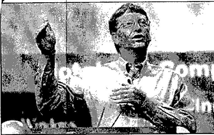
বিশ্বের সেরা ধনী বিল গেটস

ধনীরা আরও ধনী হতে পারছে না। তবে ধনীরা গরীব হচ্ছে একথা নিচুই বলা যাবে না। তবে ফরবস ম্যাগাজিন সম্প্রতি বিখ্যাত ২০০১ সালের সেরা ধনীদের তালিকা যখন প্রকাশ করলো তখন দেখা গেলো বিবিসি নিউজের শিরোনাম হচ্ছে 'দি রিচ গেই পুওরার'। তবে এটা ঠিক যে ২০০০ সালের তুলনায় ২০০১ সালে সেরা ধনীদের