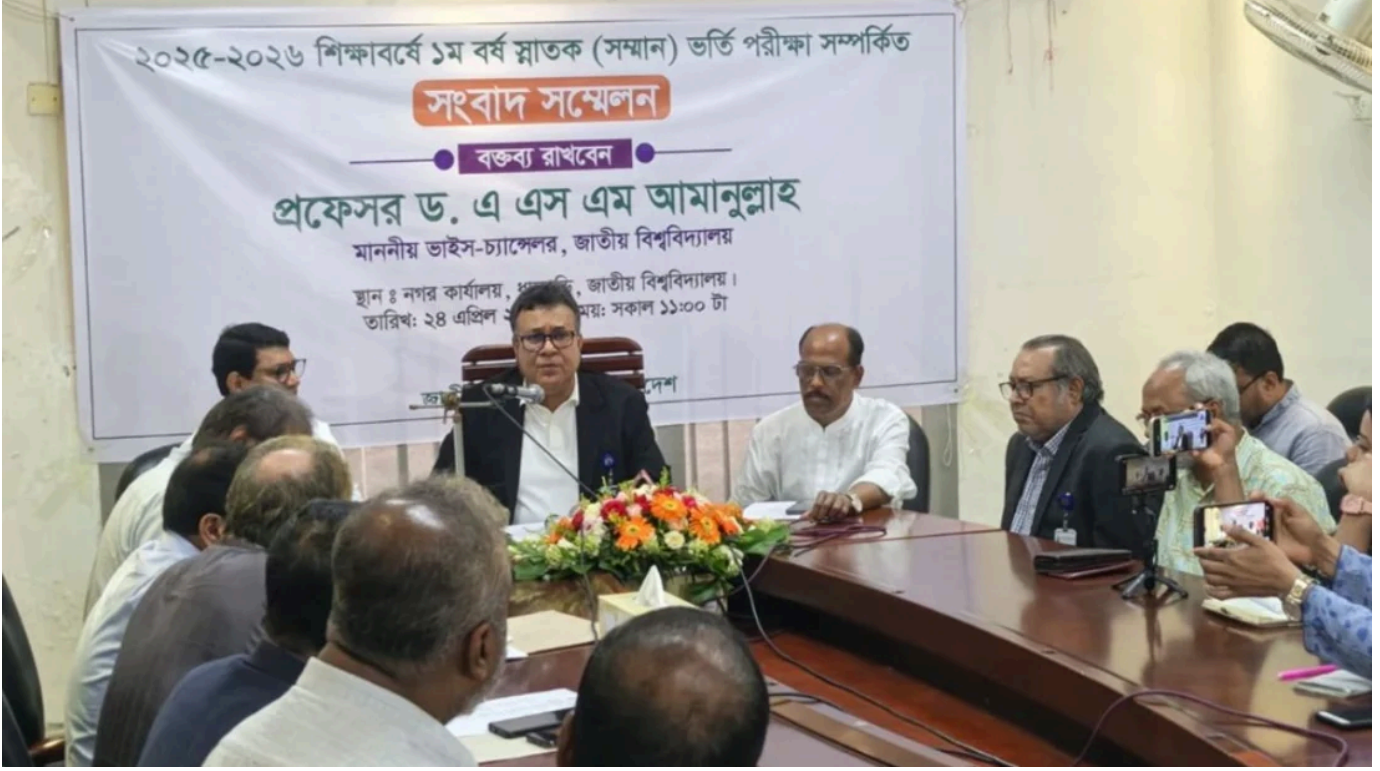
জাতীয় বিশ্ববিদ্যালয়ের ধানমন্ডি ক্যাম্পাসে আয়োজিত সংবাদ সম্মেলন।