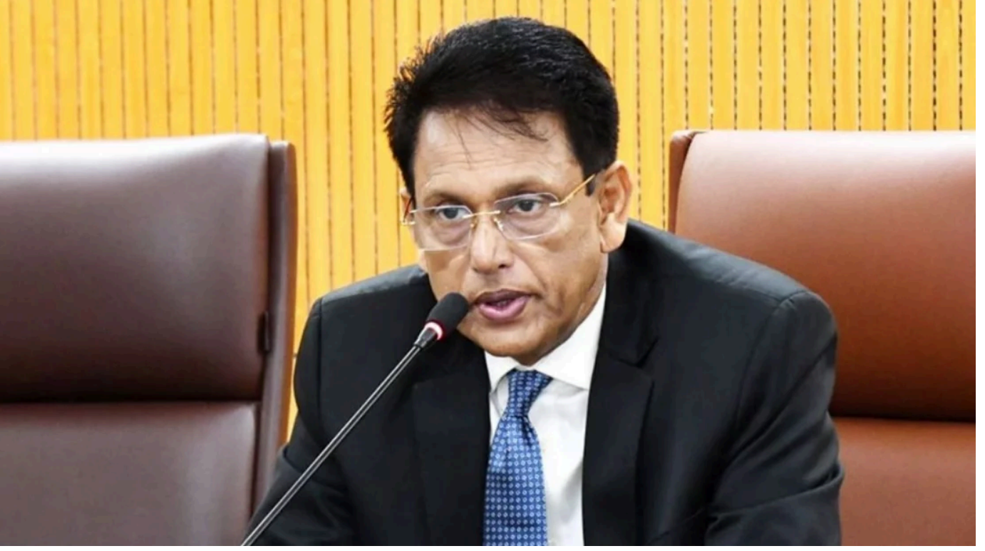
শিক্ষামন্ত্রী ড. আন ম এহছানুল হক মিলন।