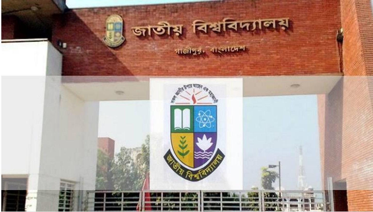
জাতীয় বিশ্ববিদ্যালয়। ফাইল ছবি

ঘূর্ণিঝড় ‘বুলবুল’-এর কারণে শনিবারের (৯ নভেম্বর) জাতীয় বিশ্ববিদ্যালয়ের বিভিন্ন পর্যায়ের পরীক্ষা স্থগিত করা হয়েছে।