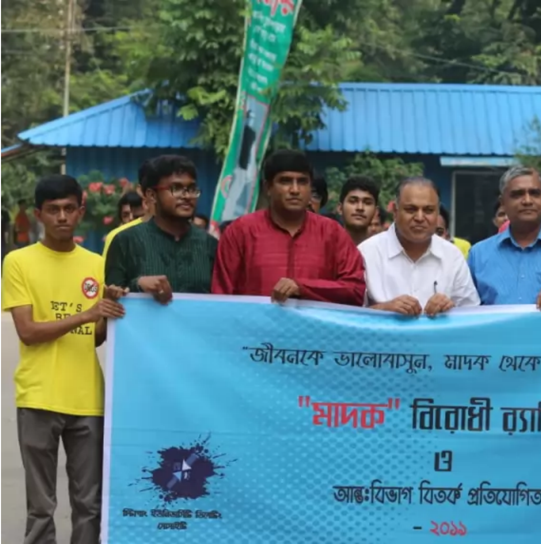
বিতর্ক প্রতিযোগিতা উপলক্ষে মাদকবিরোধী শোভাযাত্রা অনুষ্ঠিত হয়।