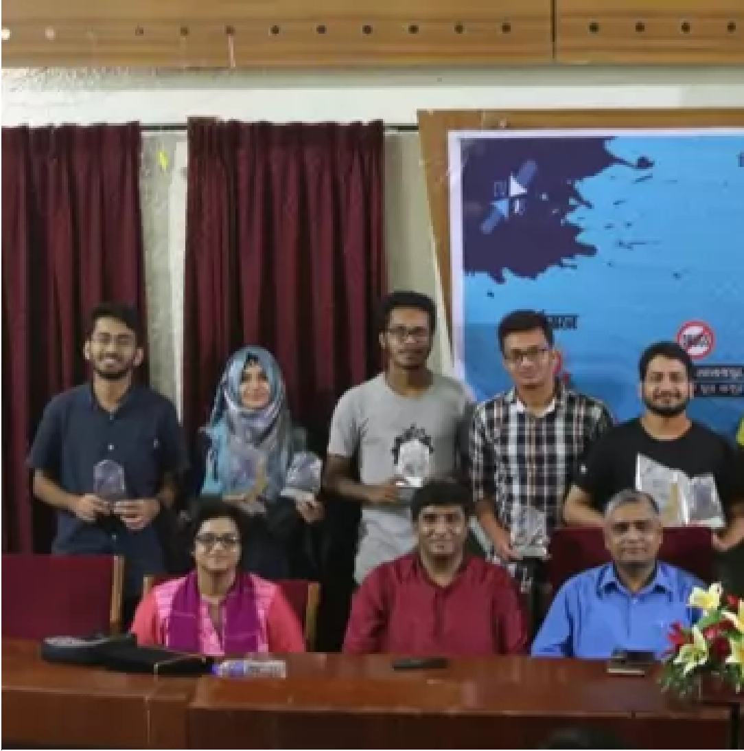
সিইউডিএসের আন্তর্বিভাগ বিতর্ক প্রতিযোগিতায় অতিথিদের সঙ্গে জয়ীরা। কেন্দ্রীয় লাইব্রেরি মিলনায়তন, চট্টগ্রাম বিশ্ববিদ্যালয়।

চট্টগ্রাম বিশ্ববিদ্যালয়ের কেন্দ্রীয় বিতর্ক সংগঠন চিটাগং ইউনিভার্সিটি ডিবেটিং সোসাইটি