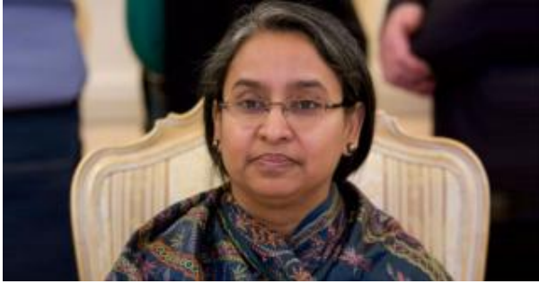
শিক্ষামন্ত্রী দীপু মনি।

জেএসসি ও জেডিসি পরীক্ষার কারণে ২৫ অক্টোবর থেকে ১৫ নভেম্বর পর্যন্ত সব কোচিং সেন্টার বন্ধের নির্দেশ দিয়েছেন শিক্ষামন্ত্রী দীপু মনি।