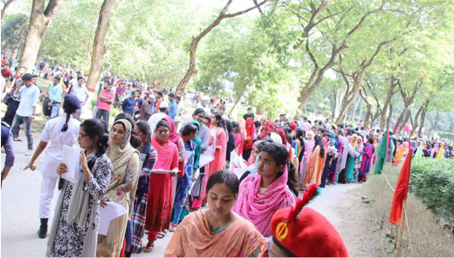
ইবিতে ভর্তি পরীক্ষা।

ইসলামী বিশ্ববিদ্যালয়ের (ইবি) ২০১৯-২০ শিক্ষাবর্ষের ভর্তি পরীক্ষার ব্যবসায় প্রশাসন অনুষদভুক্ত 'সি' ইউনিটের ফল প্রকাশ করা হয়েছে। প্রকাশিত ফলে পাসের হার ১০.৮২ শতাংশ।